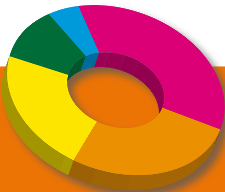
Leserprofil Readership profile

PRINT & PUBLISHING ist seit 1989 am Markt, gegründet kurz nach den historischen politischen Umwälzungen in Osteuropa. Heute zählt der Titel zu den führenden Magazinen in Zentral- und Osteuropa und vertritt den führenden Medienverbund in dieser Region. Jeweils in den lokalen Sprachen publiziert, mit Mitarbeitern vor Ort, mit interessanten und einzigartigen Netzwerk-lösungen die Ihnen nur ein international agierendes Medienunternehmen bieten kann!